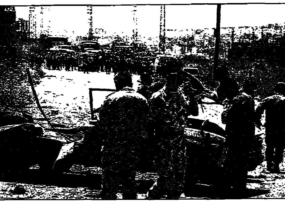
قوات الشرطة اللبنانية تتفقد الأضرار بعد انفجار قنبلة اسرائيلية في النبطية (رويترز)

جنوب لبنان، وأحد حزب الله في بيان انه فجر قنبلة... استشهاد اثنين من المدنيين بهجوم اسرائيلي على جنوب لبنان... قوات الشرطة اللبنانية تتفقد الأضرار بعد انفجار قنبلة اسرائيلية في النبطية (رويترز)